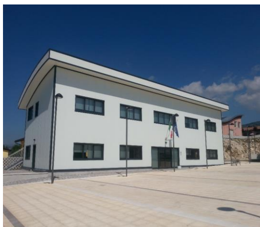
Sede Ufficio Speciale per la Ricostruzione dei Comuni del Cratere, Piazza Gemona 1- Villaggio San Lorenzo – 67020 Fossa (AQ).