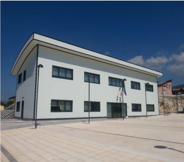
Sede Ufficio Speciale per la Ricostruzione dei Comuni del Cratere, Piazza Gemona 1- Villaggio San Lorenzo – 67020 Fossa (AQ).